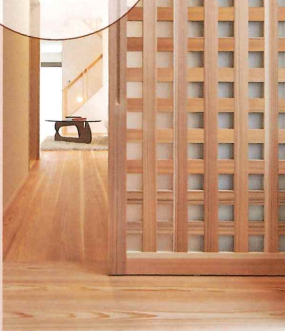
吉野杉の床と建具

[吉野杉の家]は、銘木「吉野杉」の無垢材や珪藻土などの自然素材をふんだんに用いた健康住宅です。