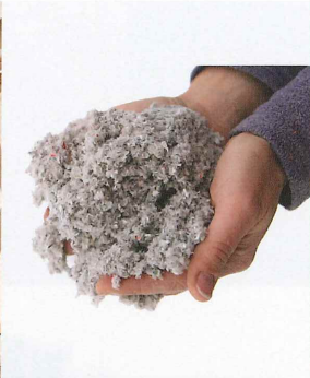
高性能断熱材セルローズファイバー