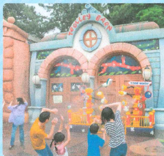
東京ディズニーランド 期間限定のびしょ濡れスポット 「"びしょ濡れ"タウンタウン」