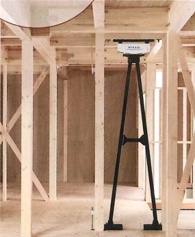
制震装置ミライエを標準搭載

地震に強く、被災後の暮らしを考えた仕様と北海道レベルの断熱性能で、安心な暮らしを実現しています。