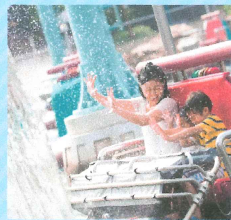
東京ディズニーシー 「アクアトピア」 "びしょ濡れ"バージョン