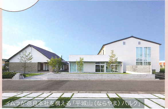
イムラが奈良本社を構える「平城山(ならやま)ハルク」

1926年に材木商として創業し[吉野杉の家]を年間70棟、累計約1300棟を建てている奈良の木を使う会社です。