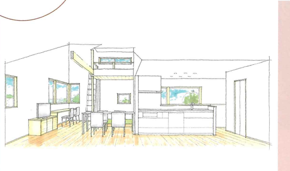
ご家族の状況や敷地の条件に合わせてプランをご提案

自然の光・風が心地よく入り、動線や収納を考慮した、世界に一つだけの暮らしやすいプランをご提案します。