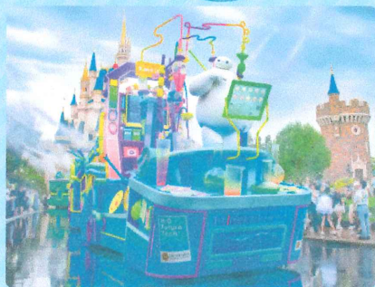
東京ディズニーランド 散水プログラム 「バイマックスのミッション・クールダウン」